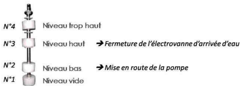
Fig. 11 : Flotteurs