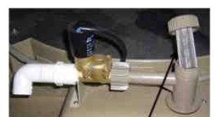
Filtre à cartouche